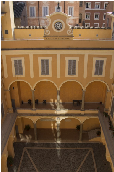
Vue générale du cloître

Ce palais du XVII e siècle est idéalement situé entre la piazza Venezia et le Largo Argentina.